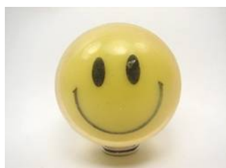
“SB 096” by L. Marie (8/10/2015)